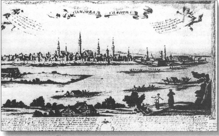
Коморан у другој половини XVII века

Храм у облику брода окренут је према истоку на најлепшем месту слободног краљевског града Коморана и подигнут од камена. Дужина основе је 28,44 метра, ширина 7,58 метара. Висина цркве код звоника је 30,33 метра. Има тринаест прозора, двоја врата у приземљу на источној и западној страни, једна улазна врата за звоник и једна за хор, као и један хор. <sup>9</sup> Под је у припрати и олтару покривен правоугаоним плочама од мрамора, у женској цркви и на хору под је од дасака.