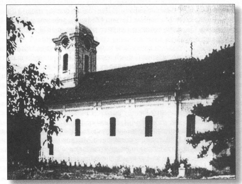
Коморанска српска православна црква посвећена Пресветој Богородици

У подунавском граду Коморану давно пре Велике сеобе развила се и столећима живела веома значајна историјска енклава Срба, којој су се временом придружили и припадници других православних народа са Балкана, пре свега Грка.<sup>1</sup> Током векова низ околности је допринео духовном и културном стасању, али и економском просперитету оних појединаца који су припадали православној заједници у том месту. Такво стање се свакако и нарочито одразило на животу месне цркве, као што су се у њеним оквирима одвијали многи главни токови постојања те заједнице. На високи степен неговања духовности и црквеног живота упућују бројни плодови материјалне културе, створене у даљој или ближој прошлости, њихов квалитет и естетски домети, као што су зграда цркве, њена опрема, утвари, одежде, књиге и др. С друге стране, на то, на пример, упућује да се између Коморанаца и манастира Хиландара одржавају везе (које до данас нису довољно испитане), да се у коморанској цркви, махом на краће време, ангажују учени и истакнути духовници, често јеромонаси, као што је знаменити проповедник прве половине XVIII века Гаврило Венцловић Стефановић.