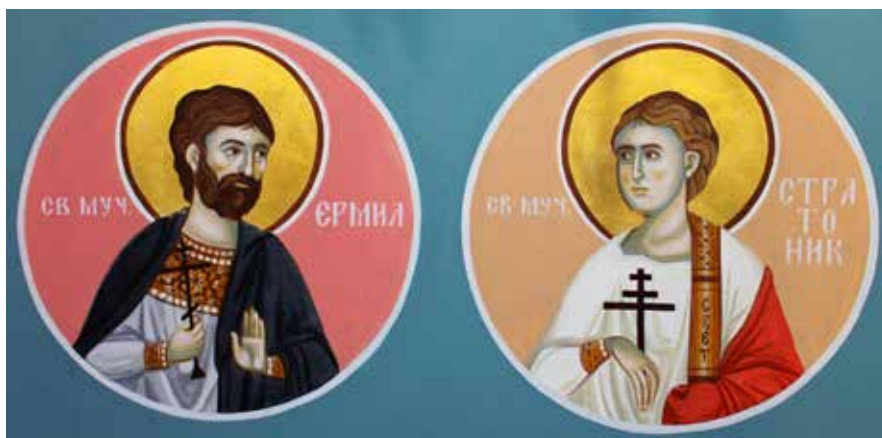
Сл. 7. Мали Мокри Луг, црква Светог Трифуна, олтарски простор, свети Ермил и Стратоник