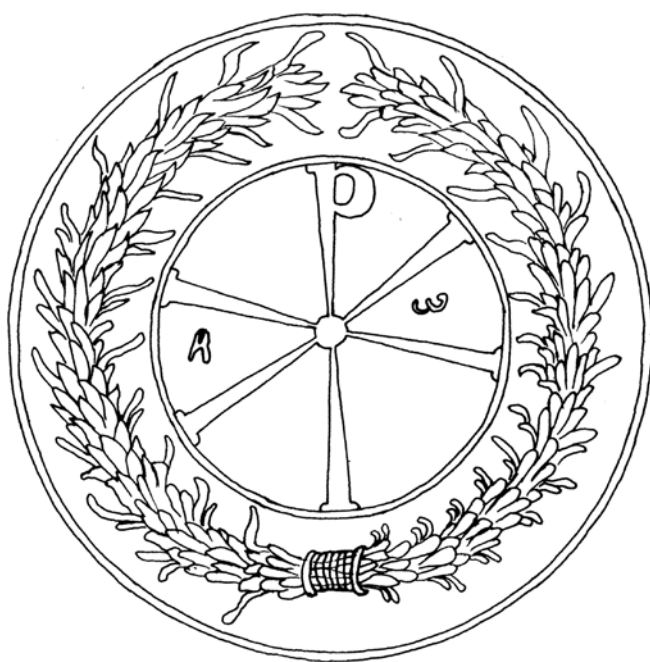
Ниш, Гробница са сидром, Константинов монограм, цртеж арх. М. Диманић Niš, Crypt with an anchor, Constantine's monogram, drawing arch. M. Dimanić