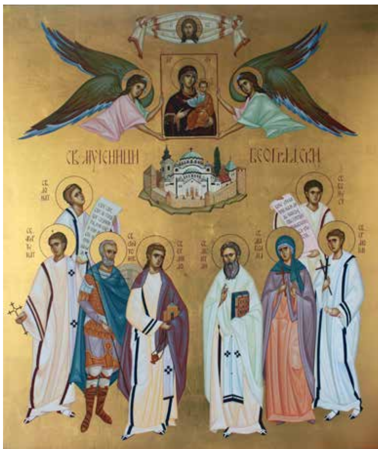
Сл. 11. Икона светих београдских мученика