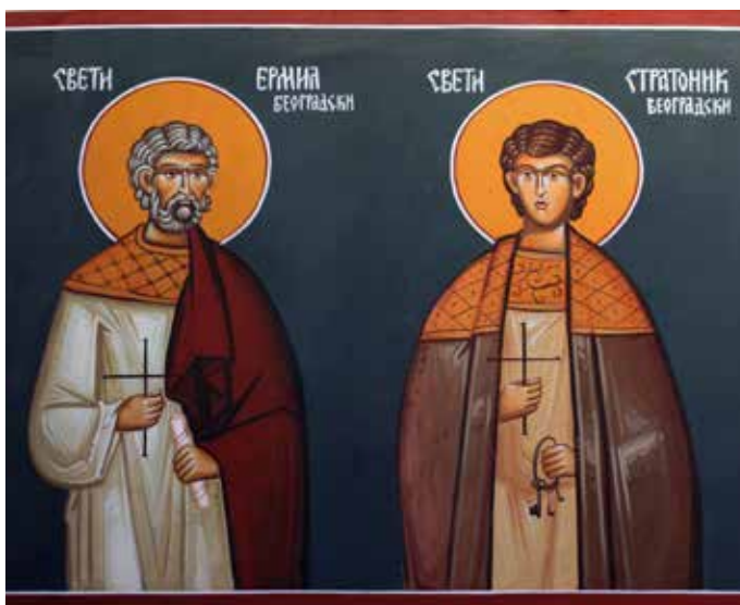
Fig. 8 Čukarica, St. Petka Church, Sts. Hermylos and Stratonikos

Патмосу (након 1185) те у цркви Светог Николе у Плаци (1337–1338) су приказани заједно са другим Христовим страдалницима у медаљонима. Њихове представе у српском средњовековном сликарству нису бројне. Били су по, свему судећи, насликани у Студеници где данас, наине, постоји само фигура Ермила из млађег слоја сликарства (1568). 10 Срећемо их у Дечанима, у потрбушју лукова који деле западни травеј наоса од јужног параклиса посвећеног светом Николи (1345–1347) где су приказани као мученици. Сва је прилика да се сцена њиховог утапања у реци налазила у оквиру Календара насликаног у припрати дечанског храма где је, најалост, живопис на месту на којем су биле илустрације за један део месеца јануара у потпуности уништен. Страдање Ермила и Стратоника у Дунаву је приказано у сликаним Календару Старог Нагоричина (1317–1318), као и оном из припрате Пећке Патријаршије из 1565. године. На сличан начин као у Пећи, у дугачким туникама, али са великим каменом око врата, приказани су и у нешто млађем сликаним Календару Сучевице (1595/1596) у Буковини на североистоку Румуније.