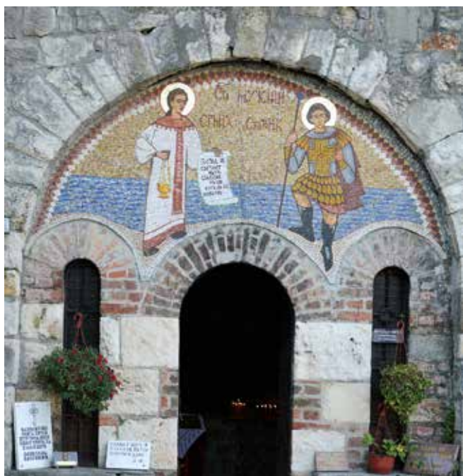
Сл. 9. Црква свете Петке на Калемегдану, фасада горионика за свеће, свети Ермил и Стратоник