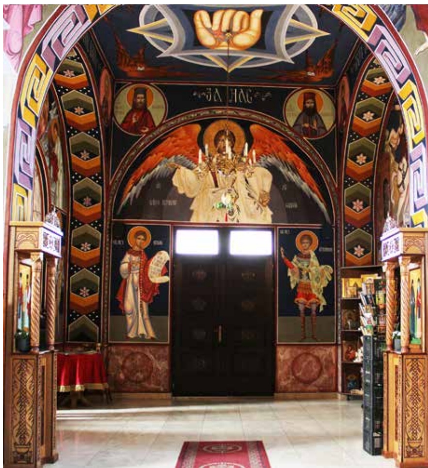
Сл. 2. Алтина, црква Светих Пајсија и Авакума, западни зид