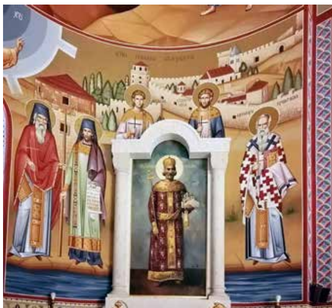
Сл. 10. Дорћол, црква Александра Невског, северна певница, свети Пајсије, Авакум, Ермил, Стратоник и Теодор Вршачки