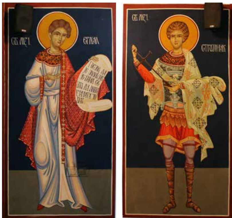
Сл. 3, 4. Алтина, Црква светих Пајсија и Авакума, свети Ермил и Стратоник