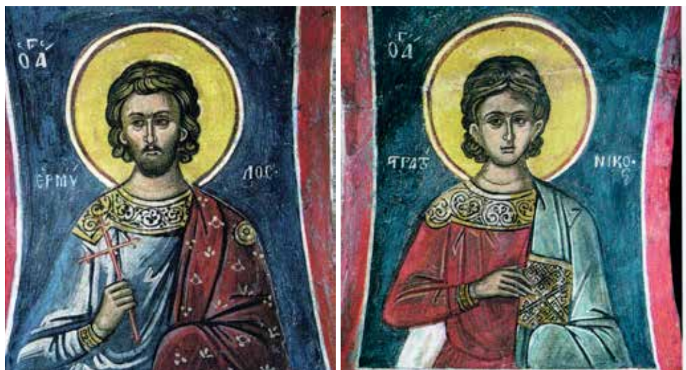
Сл. 12, 13. Света Гора, Дионисијат, свети Ермил и Стратоник, 1547 (фотографије у јавној употреби)