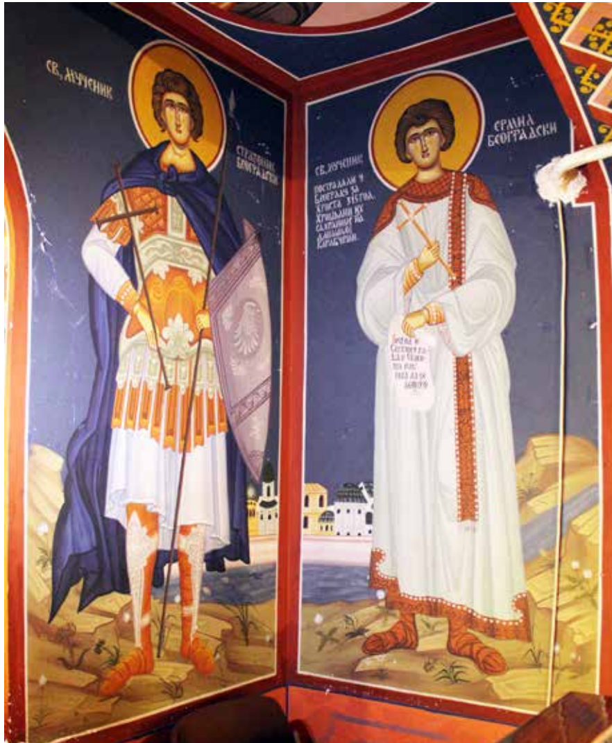
Сл. 1. Карабурма, црква Сабора српских светитеља, јужна певница, свети Ермил и Стратоник

Fig. 1 Karaburma, Church of the Assembly of Serbian Saints, southern choir, Sts. Hermilos and Stratonikos