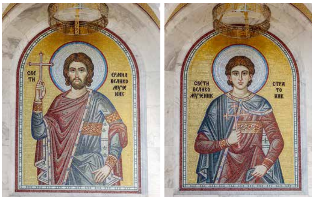
Сл. 14, 15. Врачар, Храм светог Саве, јужна фасада, свети Ермил и Стратоник