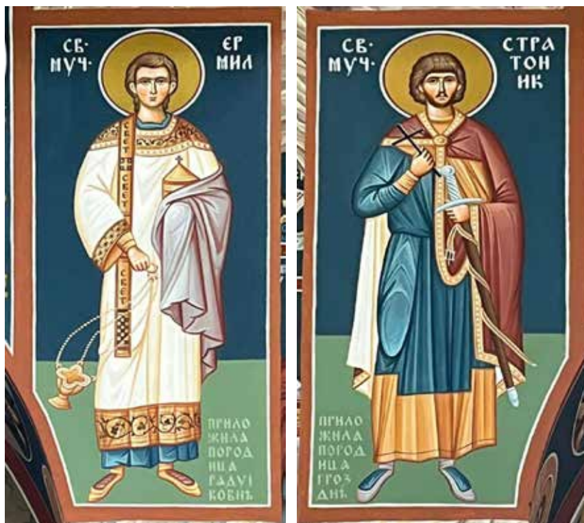
Fig. 5,6 Rušanj, St. Petka Church, Sts. Hermylos and Stratonikos

двојице београдских мученика јесте онај из пера руског ходочасника Добриње Јандрејковича, потоњег новгородског архиепископа Антонија, из око 1200. године који је забележио да су се лобање Ермила и Стратоника, заједно с другим реликвијама светих, чувале у олтару Свете Софије. 6 У Цариграду се помен двојици мученика вршио два пута годишње и то изузетно у три престоничка храма. 7 Наиме, Ермил и Стратоник су се прослављали 13. јануара и 1. односно 2. јуна, у чему је, по свему судећи, сачувано сећање на дан њиховог страдања као и на дан преноса њихових