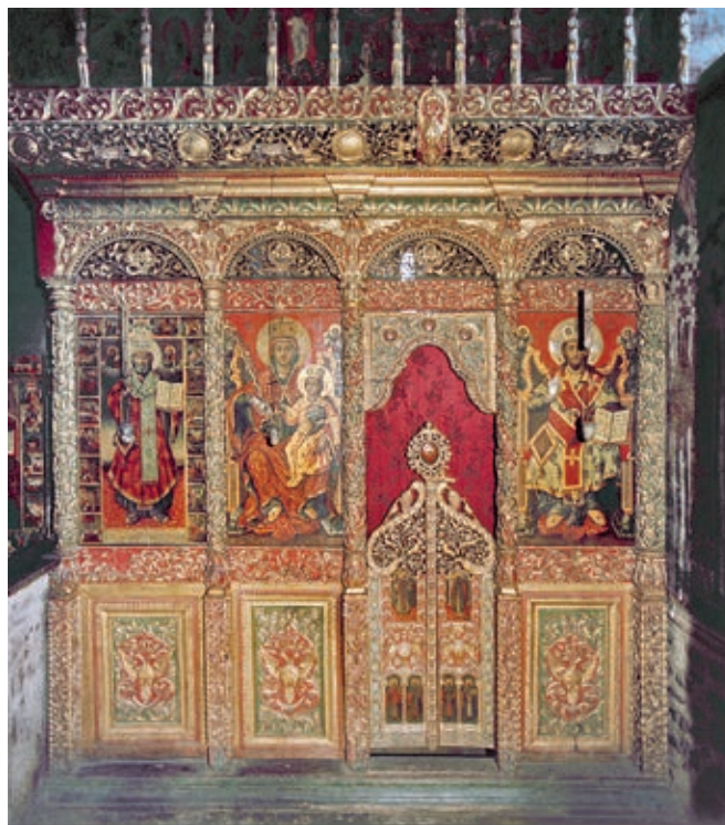
Сл. 288. Манастир Дечани, иконостас у параклису Светог Николе, 1818

Иконостас у параклису Светог Димитрија обележен је веома развијеним програмом сазданим од ликова српских светитеља. Он укључује иконе светог Стефана Првовенчаног, светог архиепископа Никодима, светог Стефана Штиљановића, светог Саве II, светог преподобног Теоктиста, светог краља Милутина, светог архиепископа Арсенија, светог архиепископа Данила, светог архиепископа Максима, светог Василија Острошког, светог преподобног Јоаникија